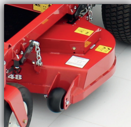
Table de coupe soudée

Les tondeuses zero turn d'Encore sont connues pour être équipées d'un grand réservoir de carburant. L'avantage est que les tondeuses ont un haut degré d'autonomie, ce qui ne profite qu'à la productivité et à l'efficacité. Les modèles Arrow ont un réservoir de 16 L, les modèles Edge ont un réservoir de pas moins de 36 L. Cela en fait le leader dans son propre segment.