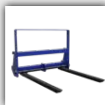
Fourche à palette