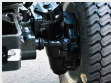
Plate-forme de véritable espace

Tous les leviers de commande ainsi que les leviers de vitesse sont placés au-dessus des garde-boue. Cela donne une plate-forme ouverte et très accessible qui est très confortable pour l'utilisateur.